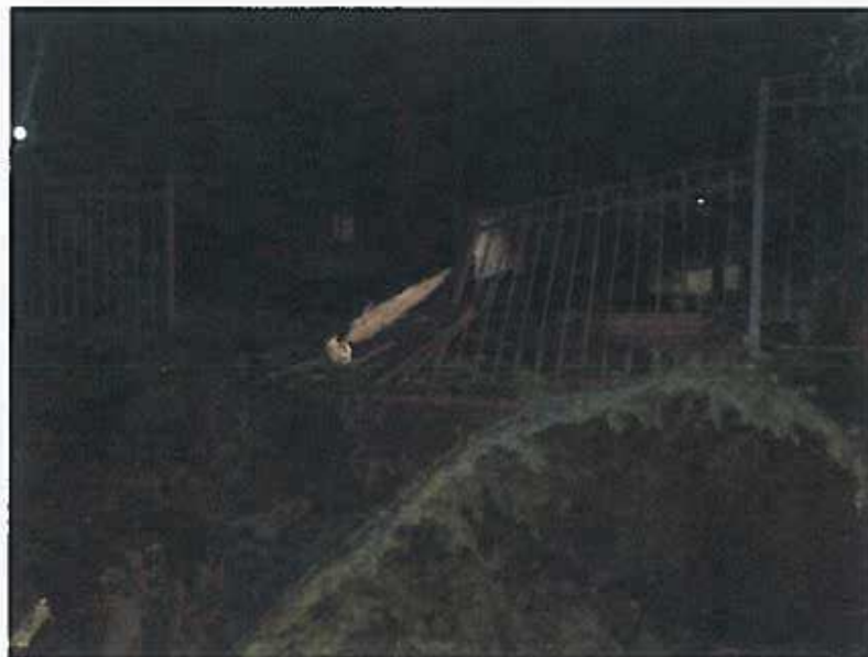
Tratto danneggiato della recinzione

POLIZIA LOCALE, PROTEZIONE CIVILE, GESTIONE RETI STRADALE E TECNOLOGICHE