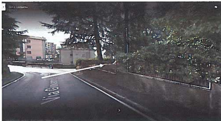
Altra visuale punto abbattimento causata da rami pino