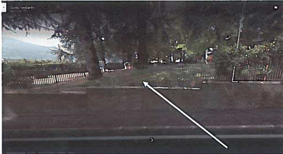
Fronte cancello asilo e punto abbattimento causata da rami pino