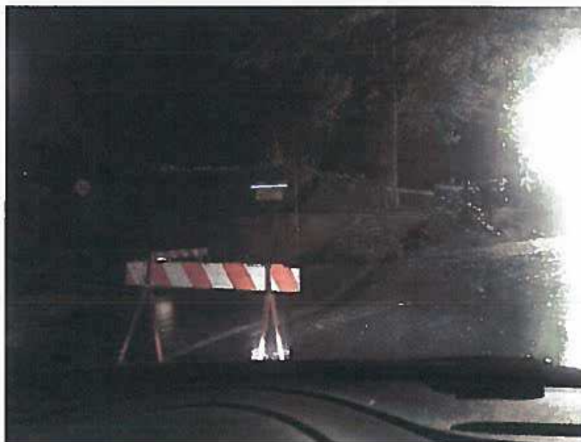
Operazioni di messa in sicurezza dei Vigili del Fuoco