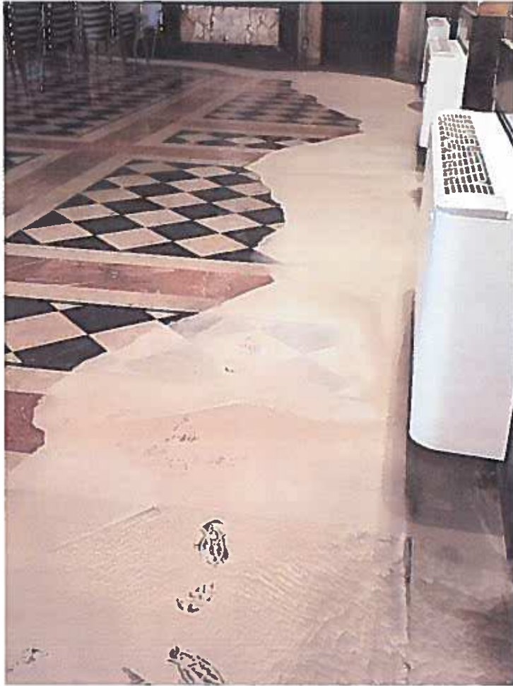
Sala principale corpo centrale (Salone d'Onore)

A handwritten signature in blue ink, located at the bottom left of the page. The signature is stylized and appears to be a name, possibly "P. P.". It is written in a cursive style.