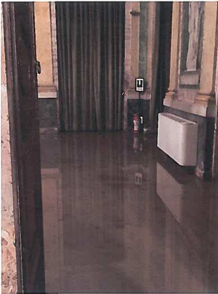
Sala d'angolo tra corpo centrale e corpo Sud (Sala di Dioniso)

A blue handwritten signature or mark, possibly a stylized 'B' or similar character, located at the bottom left of the page.