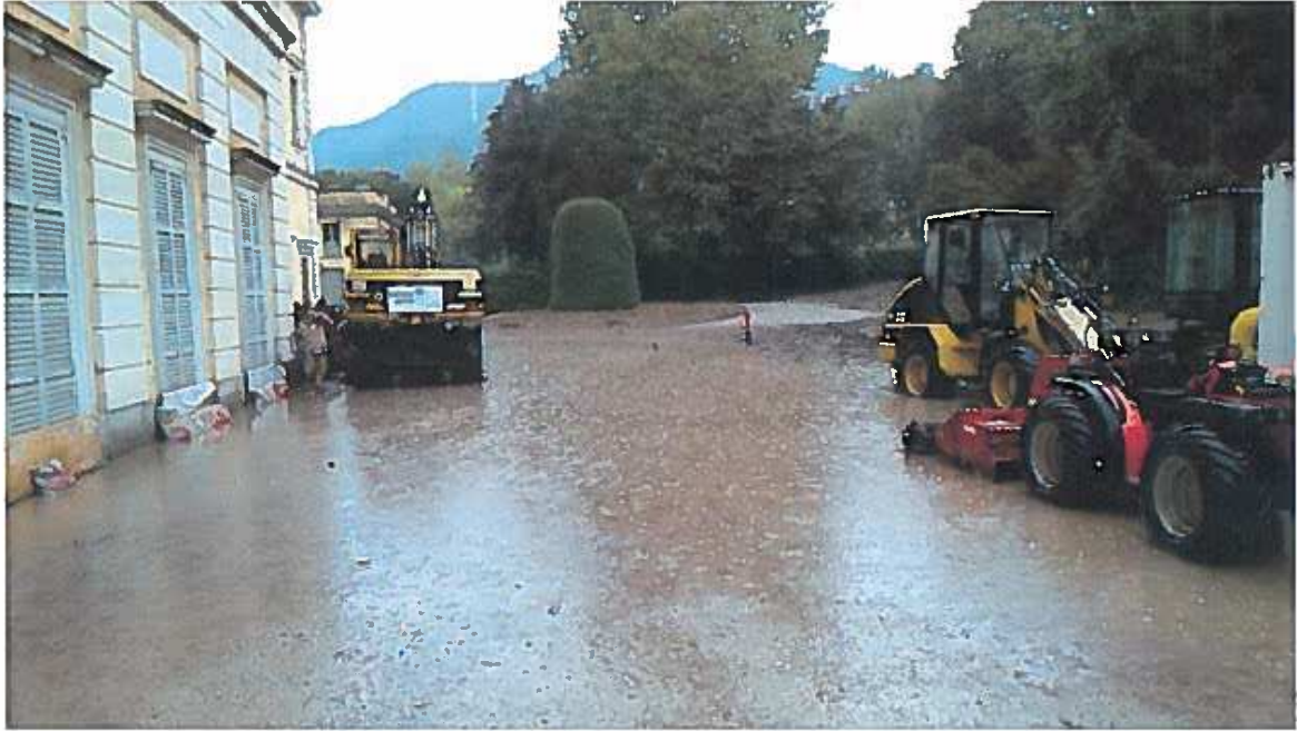
Situazione del piazzale retrostante la Villa durante il sopralluogo