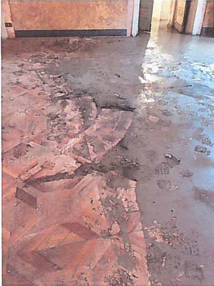
Sala con pavimentazione lignea.