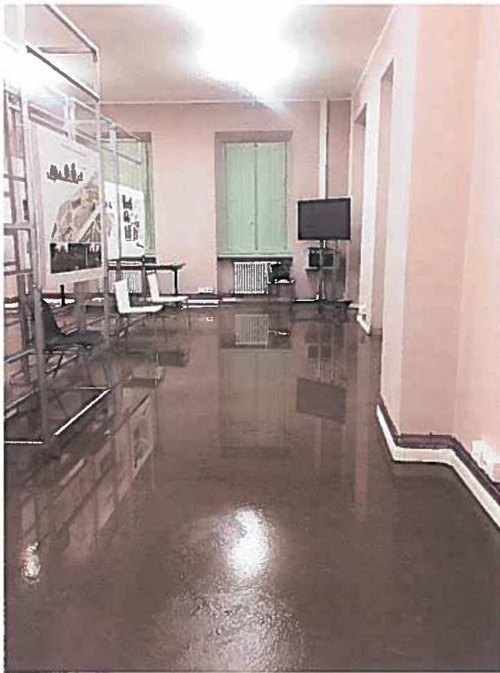
Sala principale Casino Nord

A handwritten signature in blue ink, located at the bottom left of the page. The signature is stylized and appears to be a set of initials or a name.