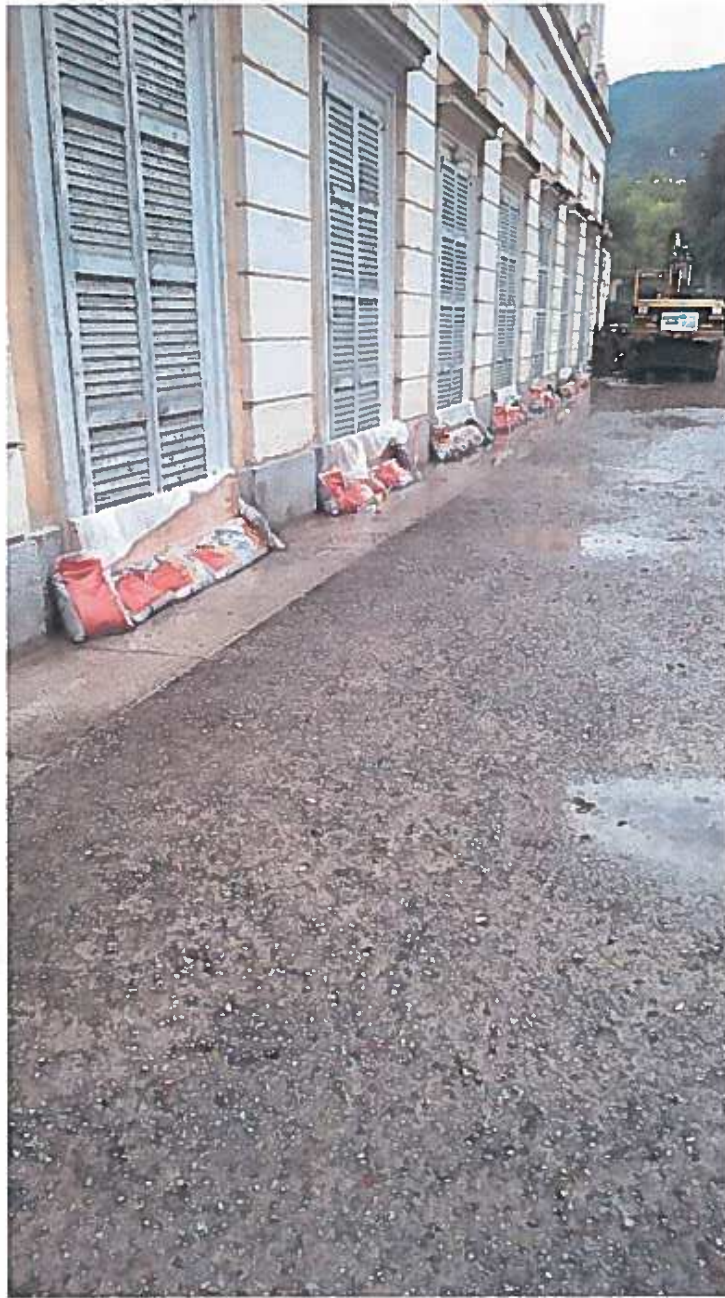
Situazione ad opere di protezione parzialmente eseguite